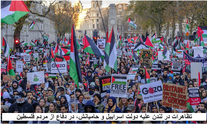
تظاهرات در لندن علیه دولت اسرائیل و حامیانش، در دفاع از مردم فلسطین

جنایت و سرکوب و برای عدالت می جنگد، با حرارت جنایات و نسل کشی در غزه را محکوم کند و در کنار مردم غزه بایستد.