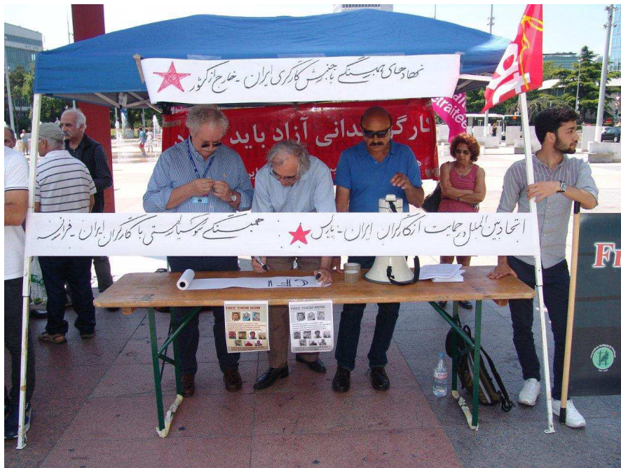
تظاهرات ۱۳ ژوئن در ژنو

در روز ۱۳ ژوئن، به دعوت کلکتیو سندیکائی برای دفاع از حق کارگران ایران و جهت آزادی های سندیکائی، حق اعتصاب و اعتراض و حق ایجاد تشکلات آزاد و مستقل در ایران و افشای حضور نمایندگان قلابی کارگران در هیان نمایندگی ایران در اجلاس سازمان جهانی کار، در اعتراض به دولت ایران تظاهرات ایستاده ای در میدان ملل ژنو در مقابل مقر سازمان ملل برگزار شد. سندیکای سوئیس از این تظاهرات پشتیبانی فعال کرده و تأمین تدارکات آن را به عهده گرفته بود. علاوه بر "همبستگی سوسیالیستی با کارگران ایران- فرانسه" و "اتحاد بین الملل در حمایت از کارگران ایران"، نوزده نهاد حامی کارگران، متشکل در نهادهای همبستگی در خارج از کشور از این تظاهرات حمایت کردند. مدافعان حقوق کارگران ایران از کشورهای سوئد، آلمان، انگلستان، سوئیس، فرانسه و هلند در این تظاهرات موفق شرکت داشتند.