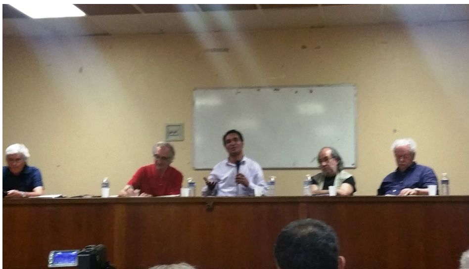
شب همبستگی با کارگران ایران در پاریس

همانگونه که مطلع هستید فعالین سندیکای کارگران شرکت واحد در طول سالیان اخیر بطور روتین تحت تعقیب و آزار و محاکمه و حبس بوده اند و نگاه و برخوردهای امنیتی نسبت به آنان و فعالین دیگر تشکلات مستقل کارگری و فرهنگی لحظه ای متوقف نشده است. تلاش جهت احقاق حقوق کارگران شرکت واحد و نیز پیشبرد مطالبات جنبش کارگری ایران بطور عموم با موانع بسیاری از جمله فشار قوه قضاییه و نیروهای امنیتی و انتظامی مواجه بوده است. در عین حال، هر ساله عده ای به نام کارگران ایران در اجلاس سازمان جهانی کار و برخی دیگر مجامع بین المللی شرکت می کنند که نه تنها ربطی به کارگر و تشکل واقع کارگری ندارند بلکه اساساً وظیفه شان این است که مطمئن گردند شکایات علیه نقض حقوق کارگران در ایران راه به جایی نبرد. این روند غیرقابل قبول و تقلب بزرگ باید متوقف گردد. امیدواریم که با تداوم پشتیبانی شما یاران گرامی و دیگر تشکلات کارگری جهانی موفق شویم در عرصه های گسترده تری حق ایجاد تشکلات و سندیکاهای مستقل کارگری را به کرسی بنشانیم.»